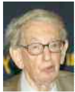
ERIC J. HOBBSAWM Historien.

Politis | Dans les premières pages de votre autobiographie (1), vous écriviez que votre livre sur l'histoire du XX e siècle, « l'Âge des extrêmes » (2), était celui d'un « participant observer », qu'on peut traduire aussi bien par « observateur participant » que par « spectateur engagé ». Que signifie pour vous ce terme, et ce nouveau livre qui paraît aujourd'hui est-il aussi une réflexion sur le début du XXI e siècle, écrite par un « spectateur engagé » ?