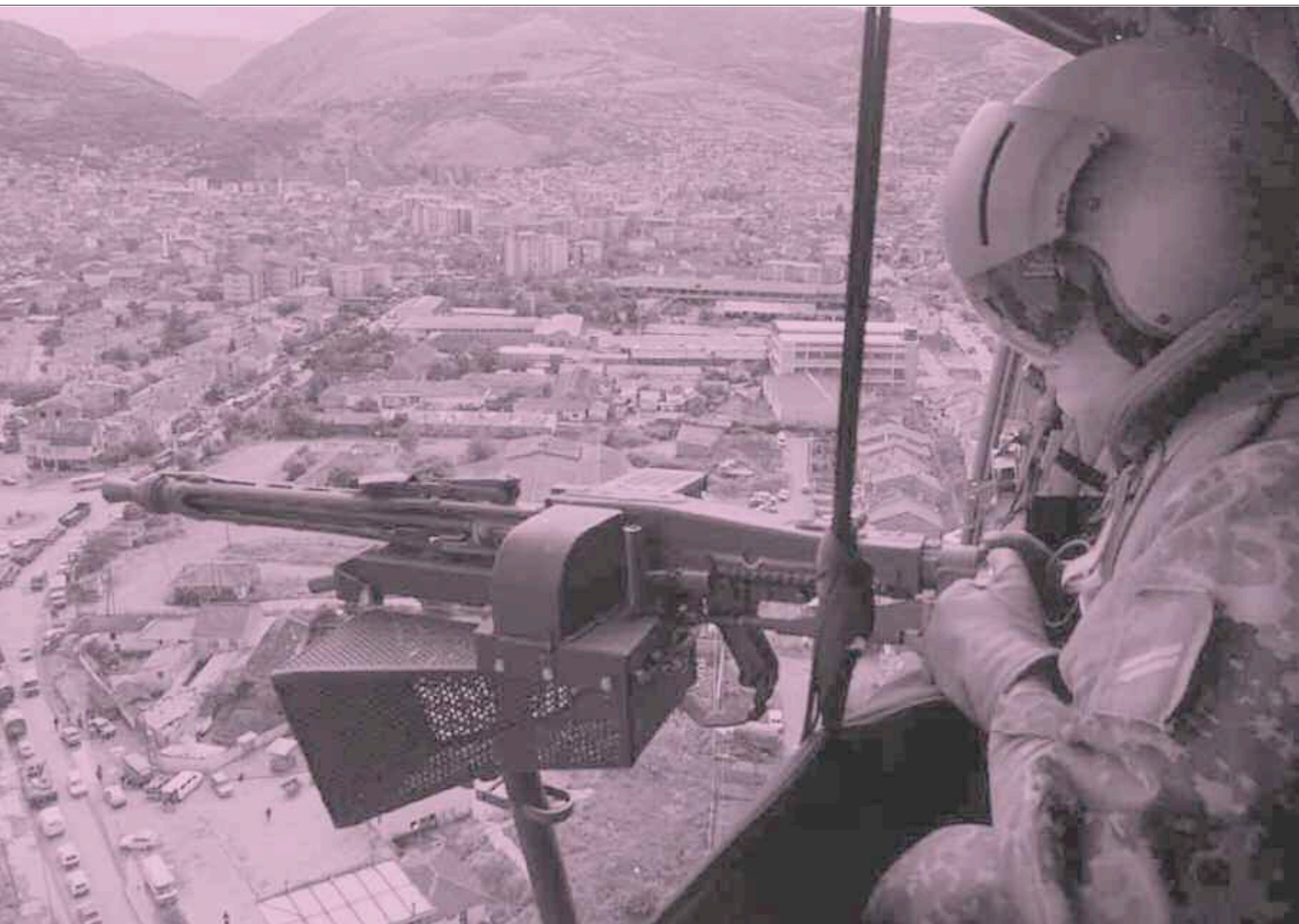
« Le concept d'impérialisme des droits humains a vu le jour avec la guerre en Bosnie. »

les derniers ont disparu à la fin de la Première Guerre mondiale, à l'exception de l'empire russe, qui, en quelque sorte, a été sauvé par la révolution bolchevique. La deuxième catégorie est celle des empires coloniaux, typiques du mode de développement du capitalisme aux XVIII e et XIX e siècles. Ceux-ci ont quasiment tous disparu également dans la seconde moitié du XX e siècle, après avoir commencé à montrer des prémices de crise durant l'entre-deux-guerres. Ce qui demeure aujourd'hui est, je crois, un troisième type d'empires que l'on pourrait appeler des empires hégémoniques, qui reposent à la fois sur l'acceptation d'une supériorité en matière de ressources, de forces et de puissance, mais n'impliquent pas nécessairement le même mode d'exploitation des territoires que les autres types. Ce que j'analyse dans ce livre est qu'il y a aujourd'hui deux empires de ce type dans le monde qui sont potentiellement capables de durer, voire de se développer : le premier est la Chine, qui d'une certaine manière parvient à faire perdurer des comportements hégémoniques dans les